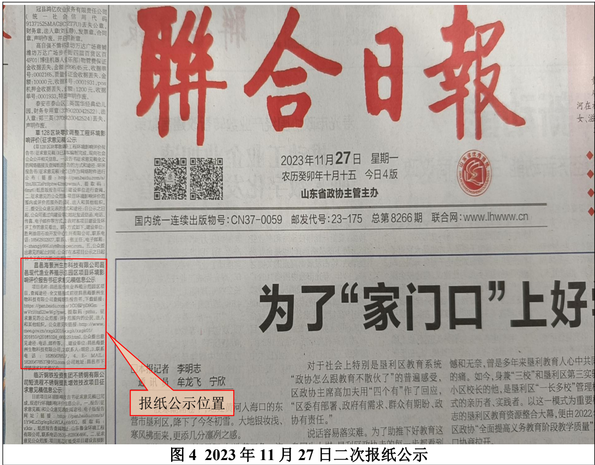
图 4 2023 年 11 月 27 日二次报纸公示