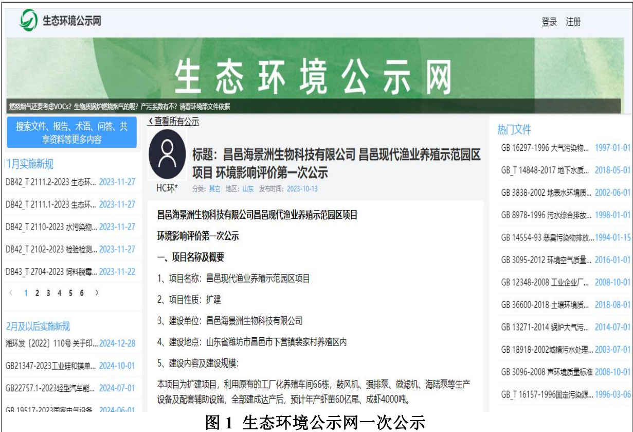
图 1 生态环境公示网一次公示