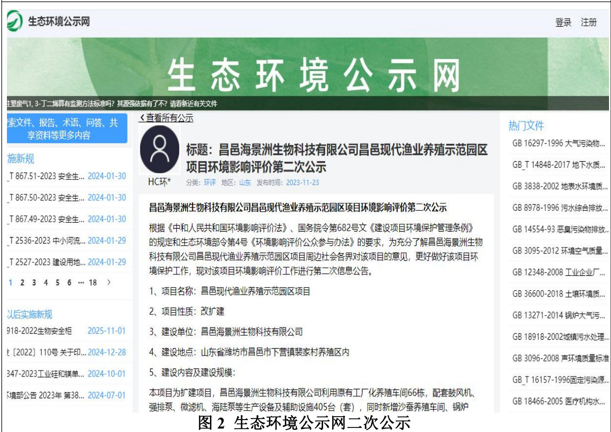
图 2 生态环境公示网二次公示