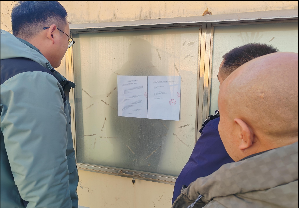
图 5 裴家庄村公示