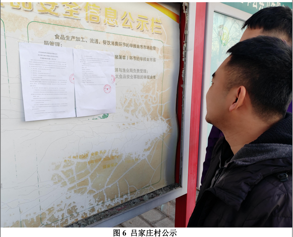
图 6 吕家庄村公示